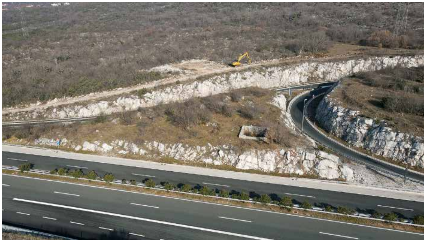
Slika B Položaj Latice u Koprivnom s vidljivom cisternom, stanje veljača 2023. godine