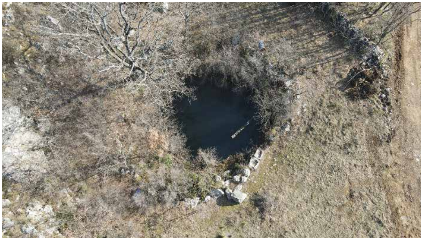
Slika C Lokva, vodena akumulacija smještena 200 m zapadno od cisterne u Laticama